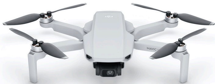
Mavic Mini(機体重量199g)

取り外し可能なアタッチメントを除き、機体本体 とバッテリーを合わせた 機体重量が200g未満の ドローン等