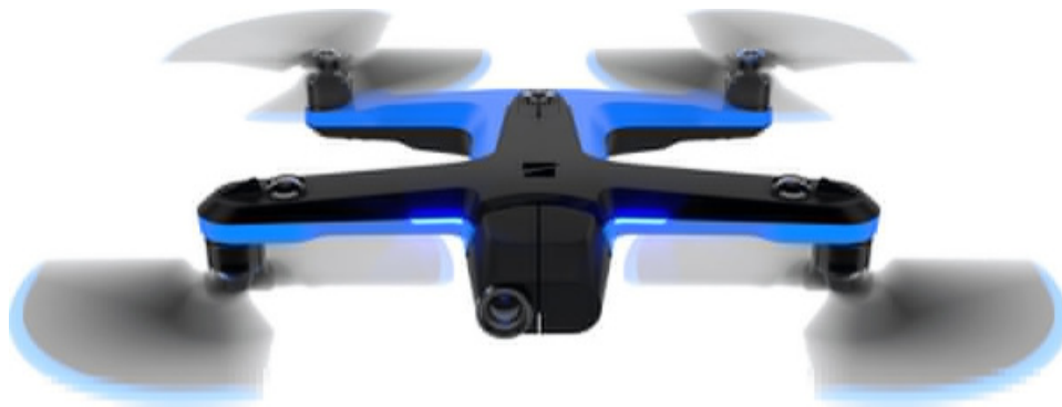
Skydio 2